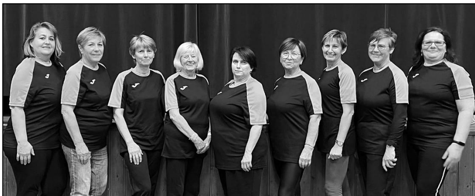
ODDÍL CVIČENÍ ŽEN

k výměně dvou plynových kotlů a byla osazena nová regulace. Realizací zakázky za více než 1,5 mil. Kč byla pověřena firma GTBC CZ. Část nákladů pokryla dotace z Programu stabilizace a obnovy venkova Plzeňského kraje, konkrétně se jednalo o příspěvek ve výši 450 tisíc korun.