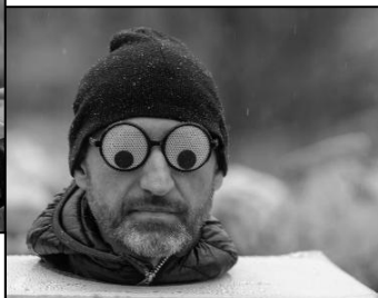
NETRADIČNÍ MASKY TIC TACŮ