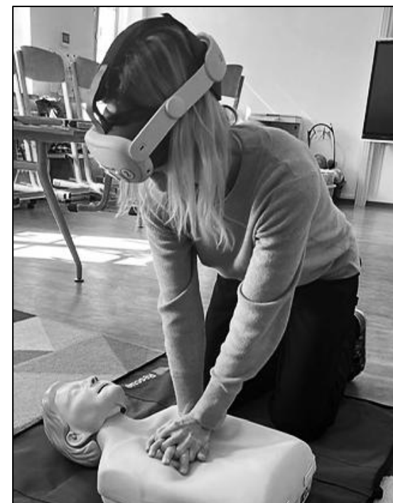
UČITELÉ SI VYZKOUŠELI NÁCVIK PRVNÍ POMOCI PROSTŘEDNICTVÍM VIRTUÁLNÍ REALITY