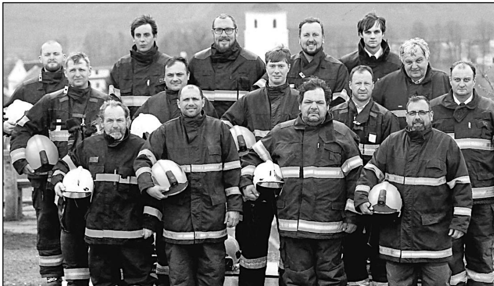
SPOLEČNÁ FOTOGRAFIE ČLENŮ VÝJEZDOVÉ JEDNOTKY SDH STRÁŽOV

Z uvedeného je patrné, že členové místní výjezdové jednotky se rozhodně nenudí. Upřímně děkujeme všem našim hasičům za dobrovolnickou a nezištnou pomoc.