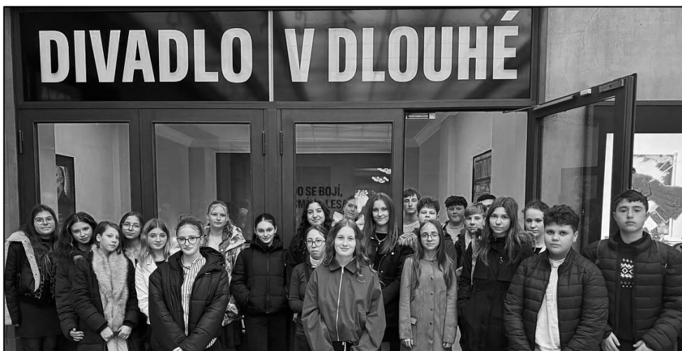
ŽÁCI ŠKOLY SE V RÁMCI KLUBU MLADÉHO DIVÁKA ÚČASTNÍ DIVADELNÍCH PŘEDSTAVENÍ

Mimo sportovních aktivit zapojujeme žáky i do těch kulturních. V rámci Klubu mladého diváka tak měli možnost navštívit několik divadelních představení v Praze, která jim nabídla