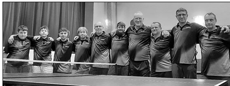
ODDÍL STOLNÍHO TENISU