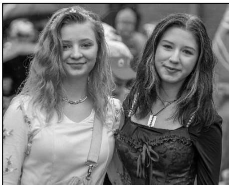
NÁRAMNĚ TO SLUŠELO TĚŽ ŽÁKYNÍM MÍSTNÍ ŠKOLY