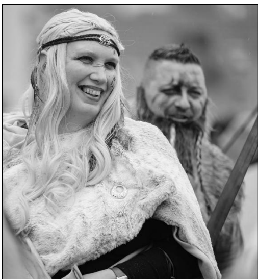
DORAZILI TAKÉ BÁJNÍ VIKINGOVÉ