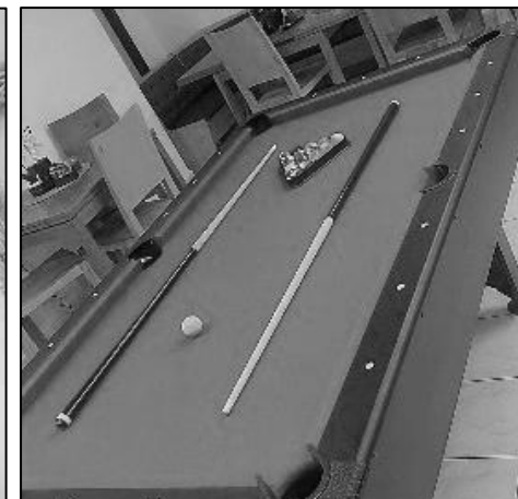
VKUSNĚ A MODERNĚ ZAŘÍZENÝ INTERIÉR RYCHLÉHO OBČERSTVENÍ BYL ROZŠÍŘEN O KULEČNÍK