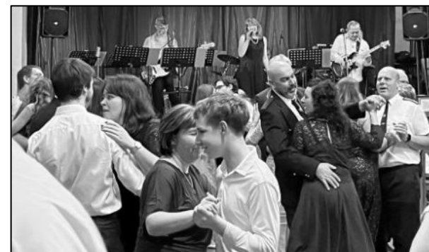
ZAPLNĚNÝ TANEČNÍ PARKET PŘI VITEŇSKÉM HASIČSKÉM PLESU

Plesy ve strážovské sokolovně mají od nepaměti veliký vzhlas. Konávalo se jich každou zimu mnoho, neboť je pořádala většina místních spolků a organizací. V posledních letech se počet plesů ustálil na třech, kromě strážovských a viteňských hasičů se pořadatelské funkce pravidelně ujímají také místní myslivci. Občerstvení na plesech pak zajišťuje TJ SOKOL. Za vším stojí mnoho hodin dobrovolnické práce, proto je vždy radost, když se konkrétní ples vydaří. A letos se náramně vydařily všechny tři. Největší návštěvnost měli myslivci, kdy na jejich ples přišlo okolo 350 hostů. Ale hojnou účast měly i další plesy, přičemž nejvíce potěšující je fakt, že převahu návštěvníků tvoří mladá generace.