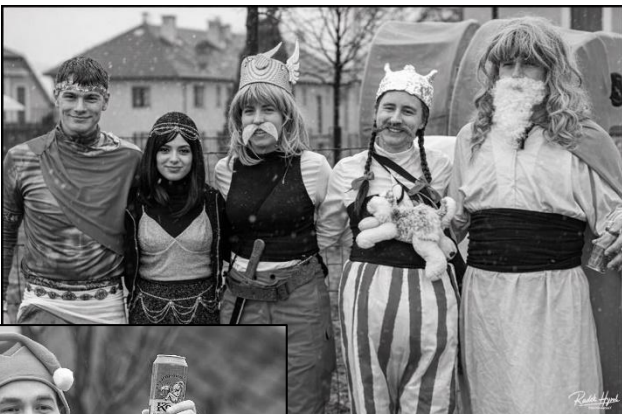
ASTERIX A OBELIX SE SVOU DRUŽINOU

14. února 2026