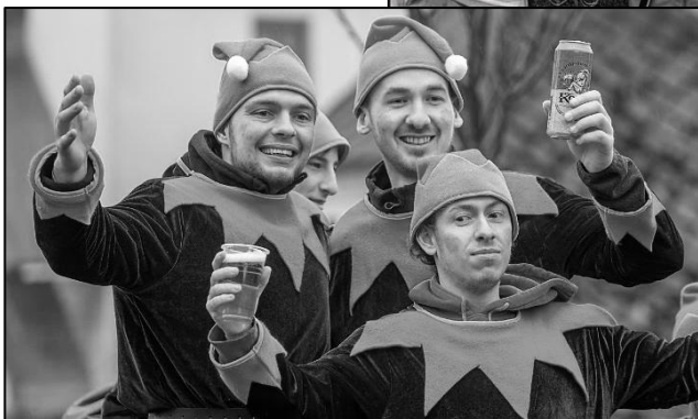
POČETNÁ BYLA SKUPINKA VÁNOČNÍCH SKŘÍTKŮ ZE ZAHORČIC A OPÁLKY